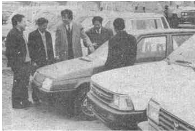
完善承包内容 推行目标管理 津县建筑公司 产值利税同步增长

行300万元债券。结果,只发行了五天就全都销完,有些想买的还没买到。“担心”变成了“放心”,孙德堂舒心地笑了。 市供销社发行债券一炮打响,在全市企业界引起阵阵涟漪。十多家企业先后跑到主管部门纷纷要求发行债券,市政公司、市化工厂、商业大厦、人民商场、东方商场、大王化学材料厂、油田大明集团公司更是不甘落后,争先吃开了“螃蟹肉”。到今年1月底,全市已有八家企业发行了3448万元的债券,半年多的发行量相当于以前历年总和的61倍。同时,南里工业公司、商业大厦、油田大明集团公司、市造纸厂共一亿多元的股票正在紧锣密鼓地发行中。 债券发行原来是“三不”现在则变成“三争”了,企业争发行,银行争代理,群众争购买,预示着我市债券市场前景看好。值得注意的是,最近我市金融界有关人士指出,今年随着管理体制的变动,政府应尽早确定协调和服务部门,以避免出现波折,以便保持我市债券市场的良好发展势头。