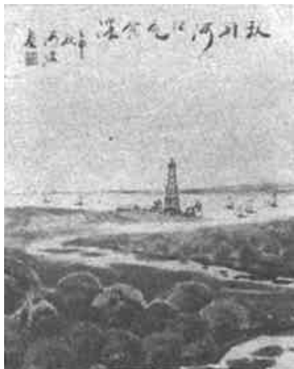
(上) 秋到河口色愈浓 (国画) 周海波 (下) 黄河口之晨