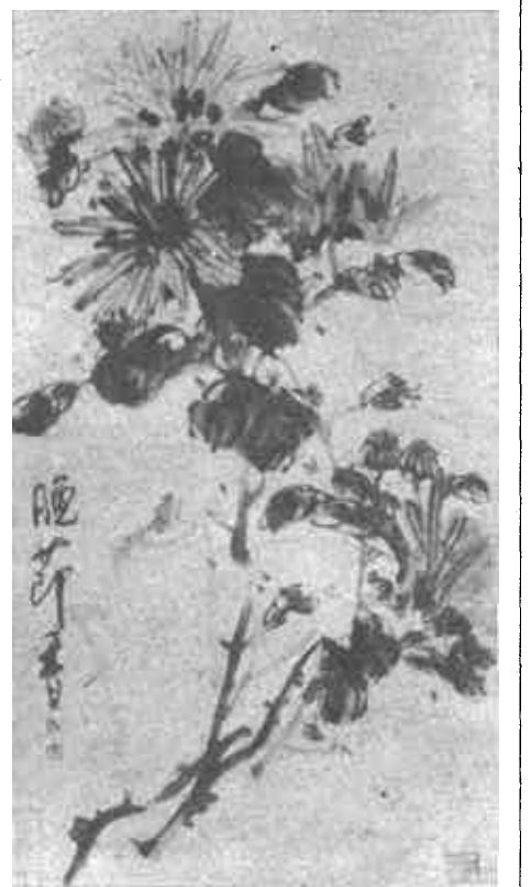
(右) 晚节香 (国画) 张丽林 (上) 清江放舟 (国画) 张丽林 (左下) 江山入画图 (国画) 许晓华